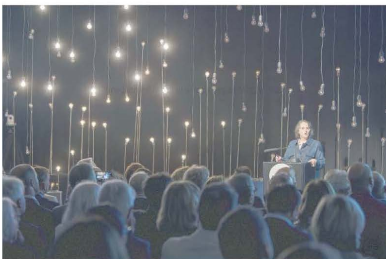
Sabato si è celebrato il 29° Dies academicus.