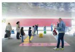
Esplorare per scoprire

Aggiudicare dall'allegro caos che ha invaso gli spazi del Campus Ovest, l'iniziativa è stata un successo, con una partecipazione ampia e variegata. Ma una valutazione di UniVerso deve anche tenere conto di quanto la giornata, con i suoi eventi per tutte le età, abbia effettivamente presentato le realtà dell'Università della Svizzera italiana. E qui va notato che se il grosso delle attività ben adattavano temi complessi ai vari pubblici, altre (per fortuna poche) parevano un po' "fuori fuoco". Ma parliamo di dettagli in una iniziativa riuscita e certamente da ripetere.